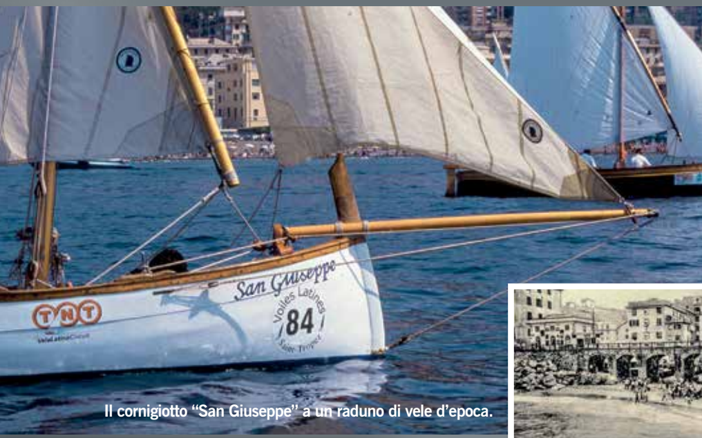
Il cornigiotto "San Giuseppe" a un raduno di vele d'epoca.

– definita dalla stessa delibera di Giunta “oggetto di speculazione e mercimonio” – da assegnare in uso ai pescatori “onde poter in tempo di mare burrascoso tirare in salvo i loro pescherecci”. Contemporaneamente si provvedeva alla limitrofa creazione di un’area non edificabile, anch’essa destinata a ospitare i natanti e le attrezzature per la pesca – con apposita fonte per l’acqua e, successivamente, di lavatoi con speciali pozzetti per le reti – denominata subito dallo stesso Comune “Piazza dei Battelli”, intitolazione che conserva tuttora”(2).