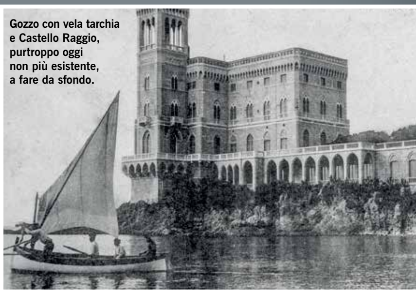
Gozzo con vela tarchia e Castello Raggio, purtroppo oggi non più esistente, a fare da sfondo.

l'atmosfera di quei tempi: una folla di uomini in "paglietta" affolla la spiaggia di Sestri Ponente, mentre il mare pullula di gozzi di vario tipo, tra cui si distinguono diversi gozzetti, che appaiono simili a quelli di oggi. Lo scafo del gozzetto, lungo 6 metri, è largo solo novanta centimetri e quindi per la manovra dei remi è necessario attrezzarlo con scalmiere esterne. La struttura è leggerissima, tanto che il peso supera di poco gli ottanta chilogrammi. L'equipaggio rema in modo