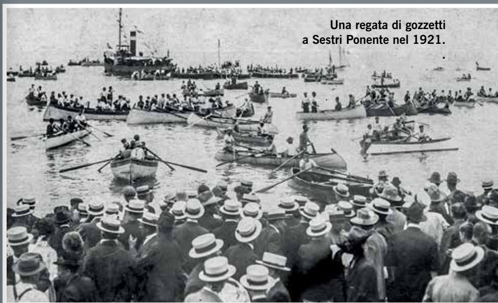
Una regata di gozzetti a Sestri Ponente nel 1921.

bagnanti. Così, in tutte le stagioni il litorale era animatissimo e dava ospitalità a centinaia di gozzi da pesca, tra i quali prevalevano i “cornigiotti”, quelli con il dritto di prua volto all'indietro. Questi gozzi sono considerati tipici della Liguria, anche se non sono l'unica imbarcazione mediterranea a presentare questa caratteristica. L'arretramento del dritto poteva variare: in alcuni è appena percettibile, mentre in altri era accentuato. Prendevano il loro nome da Cornigliano, dove la spiaggia era particolarmente stretta, addossata alla massicciata della ferrovia, e il mare era subito profondo: quel tipo di prua offriva una riserva di galleggiamento addizionale quando la barca scendeva in mare, operazione che bisognava svolgere tutti i giorni, perché i gozzi potevano essere ricoverati solo ne-