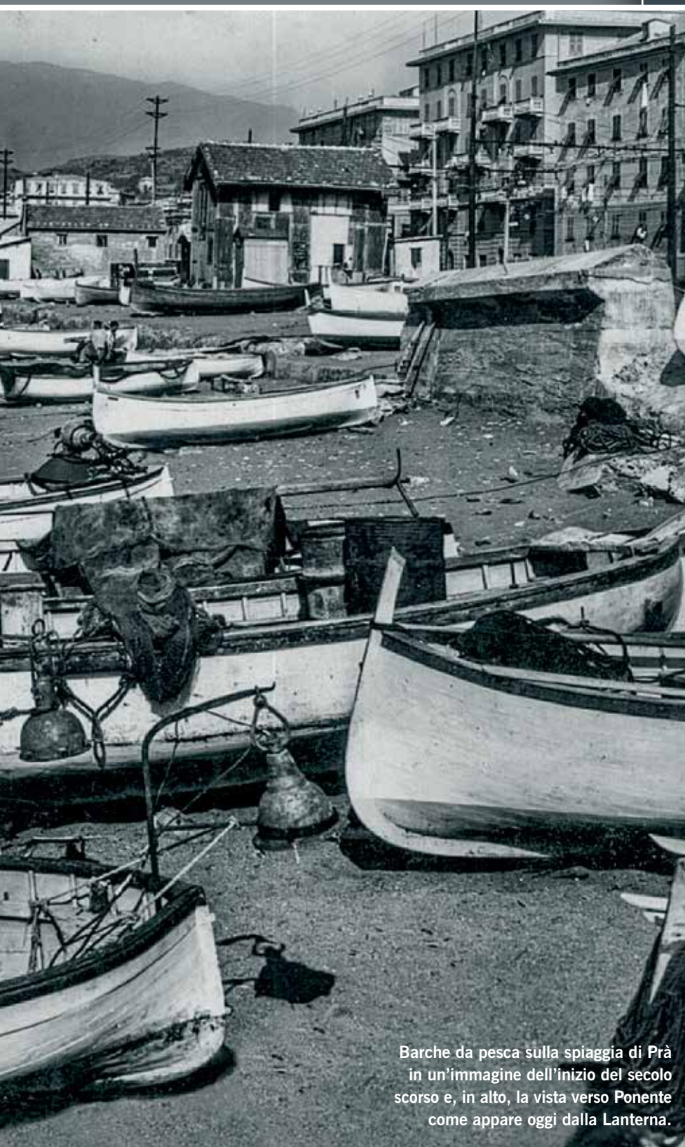
Barche da pesca sulla spiaggia di Prà in un'immagine dell'inizio del secolo scorso e, in alto, la vista verso Ponente come appare oggi dalla Lanterna.