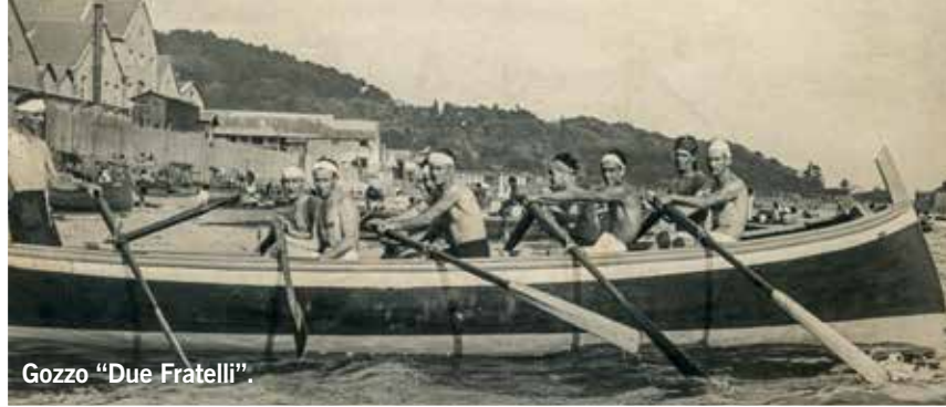
Gozzo "Due Fratelli".

Marinai e pescatori, tutti quelli che per tutta la vita passavano lunghe giornate di lavoro a remare, nei giorni di festa hanno sempre organizzato delle gare... di remo. Erano competizioni molto sentite perché mettevano in gioco la capacità, la forza e l'orgoglio professionale. Per lo stesso motivo, queste gare erano seguite da un pubblico numeroso e competente, da un "popolo di marinai" che non perdeva l'occasione di fare il tifo e scommettere i propri denari. Per le regate si